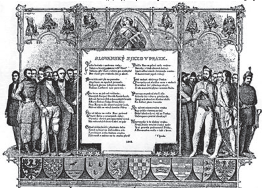
Doborý plagát s podobičňami účastníkov Slovanského zjazdu

Myslel by si človek, že vari pod heslom a zásterou panslavizmu dáke križiacke ťaženie na všetky európske národy sa vyrútiť má; a vskutku, čo aj nie takúto výpravu, ale v inom spôsobe hroznejšiu ešte od všetkých tých ťažení si pod panslavizmom predstavovali, nič menšieho pod ním nemysliac, ako že národy slovanské (Slávi), a to všetky (pan), pod náčelníctvom ruským na Európu sa vyvalia a na spôsob Atilov a druhých takýchto hrozných vojníkov Európu pustošiť a národy európske do rabstva zajať budú.“ A ďalej pokračuje: „Skutočne, práve to tak bolo, ako s dáakým zázračným, dosiaľ nevidaným úkazom; ako na tento úkaz ľudia hľadájú, duria sa ho a plašia, tak i na tento, dosiaľ