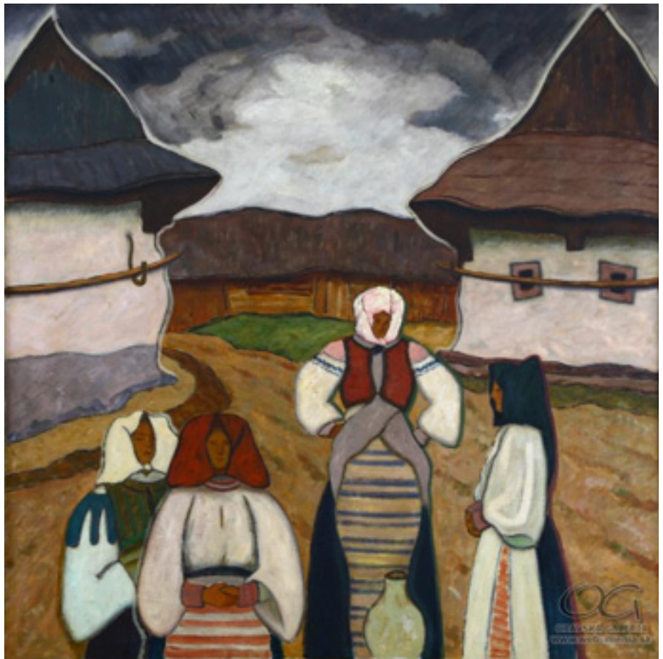
M. A. Bazovský - Ženy pri studni

Jozef Hanula (* 06.04.1863 Liptovské Sliače - † 22.08.1944 Spišská Nová Ves)