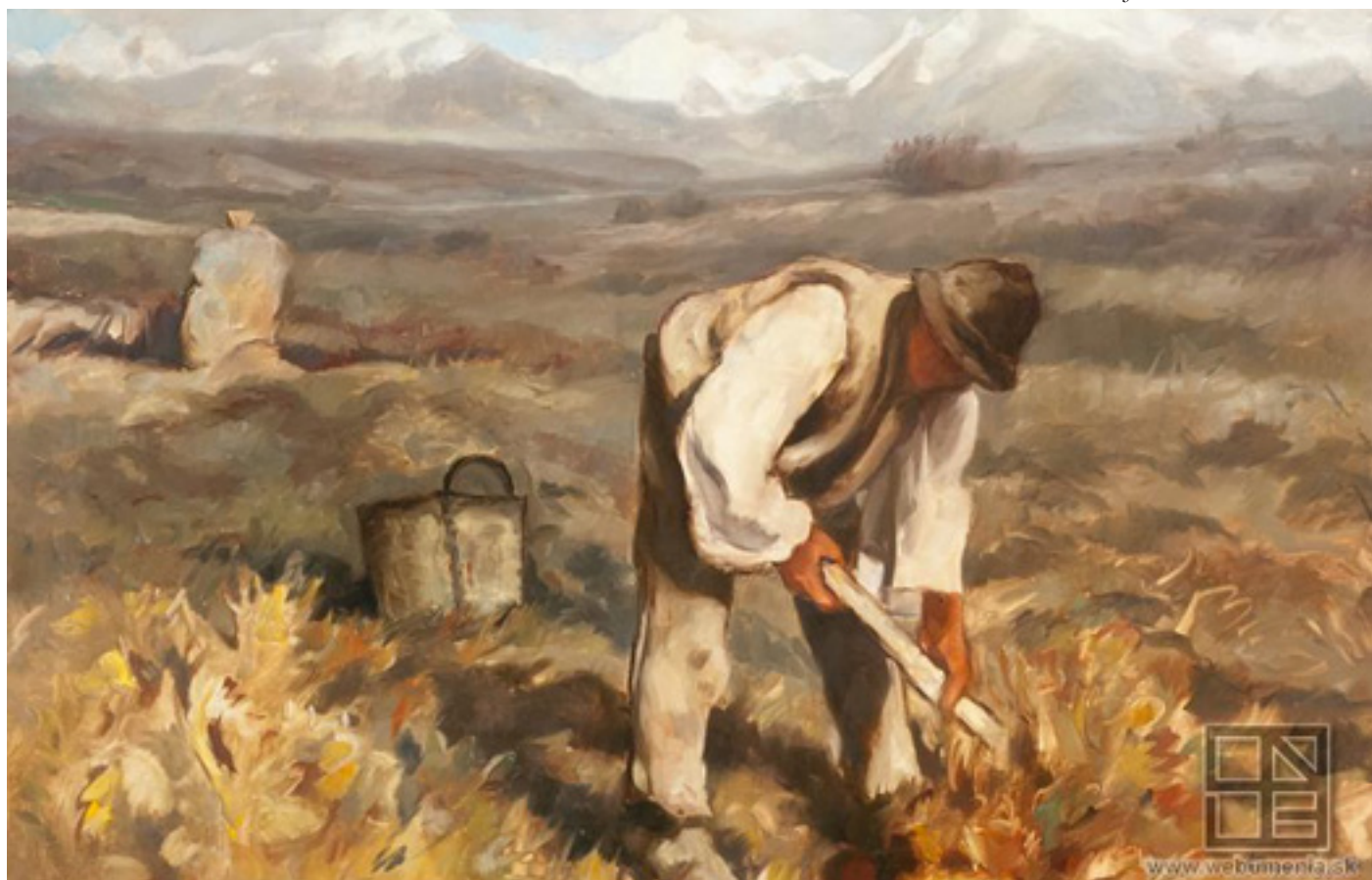
Zolo Palugyay - Jesenná práca aký život museli títo ľudia prežívať. Som týmto maliarom vďačná, že nám zanechali tak nádherný odkaz a verím, že nie som sama.

a umelcami akými boli napr. Janko Alexy, Martin Benka alebo Štefan Krčméry. Vo svojich dielach sa venoval hlavne slovenskej krajine, zobrazoval prírodu v rôznych obdobiach, takisto prostý ľud, hlavne bačov, ale venoval sa aj vojenským motívom