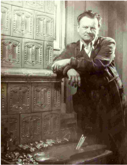
Miloš Alexander Bazovský

významný maliarom, jedným z najreprezentatívnejších predstaviteľov umenia počas 20. storočia na Slovensku. Bol vymenovaný „národným umelcom“. Patril medzi zakladateľov slovenskej moderny, jeho prejav bol veľmi originál-