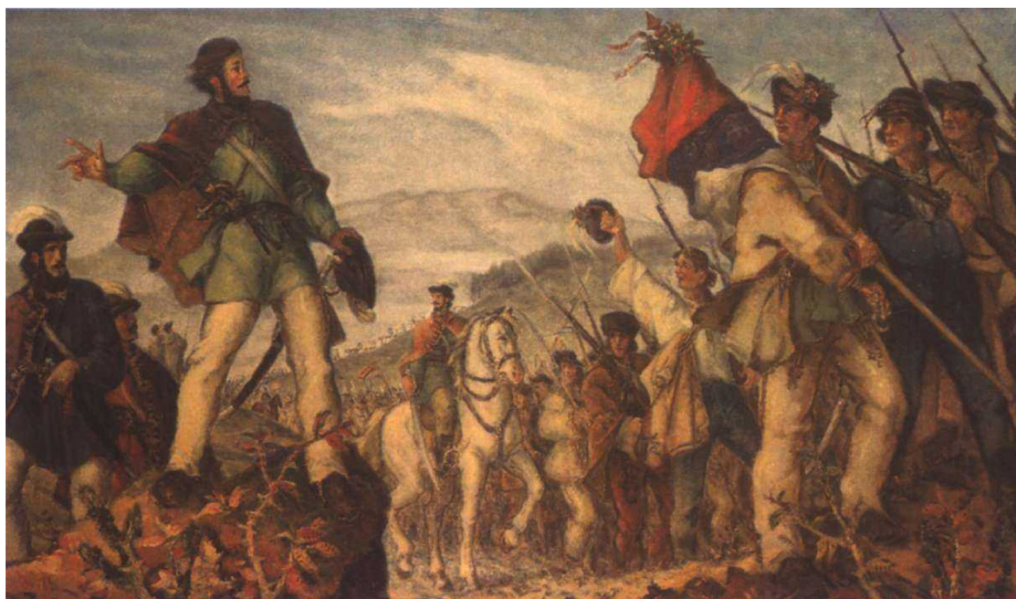
Martin Benka - Ludovít Štúr ako vodca slovenských revolucionárov

a v tomto meste je takisto aj múzeum tohto výnimočného maliara.