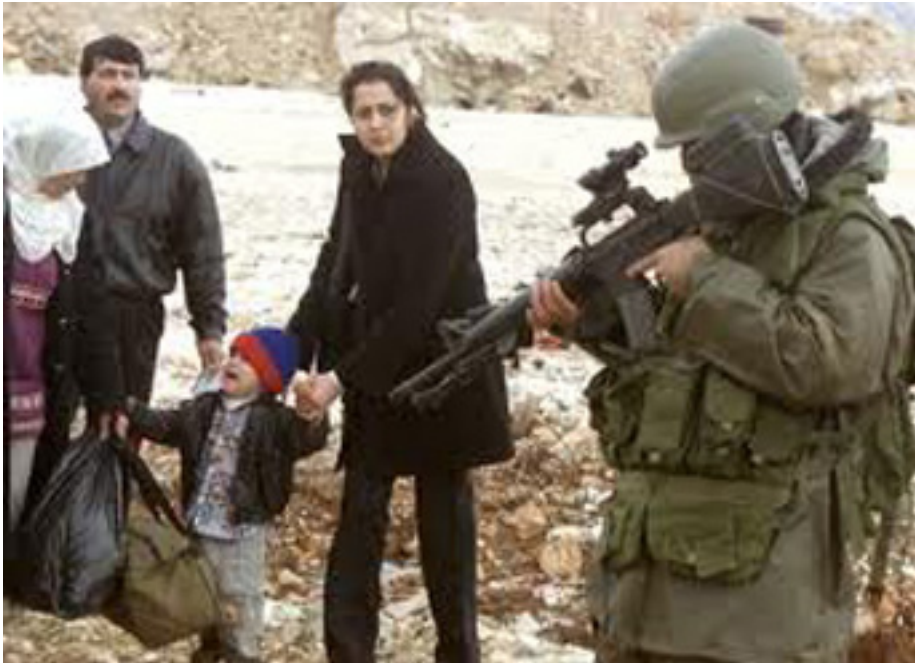
Izraelský vojak mieri na malého palestínskeho "teroristu"

politiky západu v moslimských a iných krajinách. Francúzsko dlho považovala Alžírsko za súčasť svojej krajiny, tak mnoho Alžírčanov sa legitímne nastahovalo do Francúzska a vytvorilo veľkú enklávu. Tak isto môžeme hovoriť o ostatných európskych štátoch vrátane Veľkej Británie, ktorá vlastnila celú Indiu.