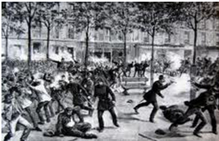
Štrajk robotníkov - Chicago

Po roku 1989 bola väčšina výrobných prostriedkov vo vlastníctve štátu. Našli sa však politici, ktorí tento národný majetok postupne rozpredávali do rúk kapitalistom. Hlavne kapitalistom zo zahraničia. Za vyše dvadsaťročného obdobia Slovákom nepatrí už takmer nič. Všetko drží v rukách najmä zahraničná buržoázia, ktorá naďalej vykorisťuje pracujúcich. Moderní pracujúci pracujú za smiešnu mzdu vo fabrikách, ktoré vlastní cudzinci. Sú vydieraní výpoveďou, ak nebudú akceptovať chabé podmienky, ktoré im poskytujú zamestnávate-