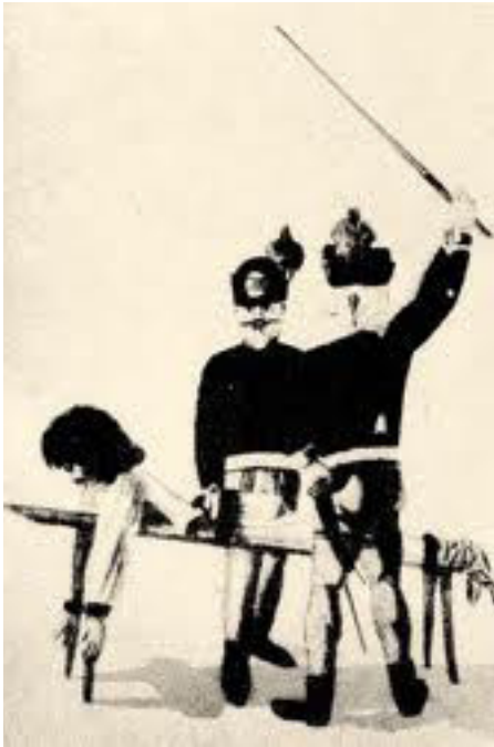
Dereš - nástroj útlaku

sku. Feudáli vyberali od Slovákov veľké renty v naturáliách a veľmi bolo rozšírené najmä povinné robotovanie. Feudáli siahli po povinnom robotovaní najmä preto, že výška finančných, či naturálnych odvodov sa časom valorizovala a preto strácali odvody hodnotu. Pri robotovaní tento problém odpadával. Všetci dobre poznáme a je to i súčasťou slovenského folklóru, že poddaní chodili pracovať na panské. Toto robotovanie bolo povinné a kto nešiel, bol potrestaný. Dereše fungovali na plné obrátky. Slováci boli brutálne týraní a vykorisťovaní. Mnohokrát naturálne, či finančné renty prevyšovali náklady na život a preto mnohokrát dochádzalo k hladomoru, preto čas od času vznikali roľnícke vzbury a povstania. Jedným zo znakov feudalizmu je práve prehlbujúci sa triedny konflikt, ktorého výsledkom je už otvorený násilný konflikt. Triedny konflikt nastáva vtedy, ak jedna trieda vykorisťuje druhú, ak jedna vrstva utláča druhú.